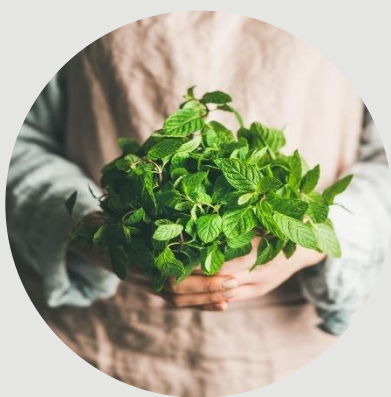
Afbeeldingsbijschrift: Om uw document er professioneel uit te laten zien, hebben de koptekst, de voettekst, het voorblad en de tekstvakken in Word een ontwerp in dezelfde stijl.

En dankzij de nieuwe leesweergave is het lezen van documenten nog gemakkelijker. U kunt bepaalde delen van het document samenvouwen en u volledig concentreren op de gewenste inhoud. En als u stopt met lezen voordat u het einde bereikt, wordt de plaats waar u bent gebleven bewaard, ook als u hebt gelezen op een ander apparaat. U kunt ook thema's en stijlen gebruiken om uw document consistent te maken.