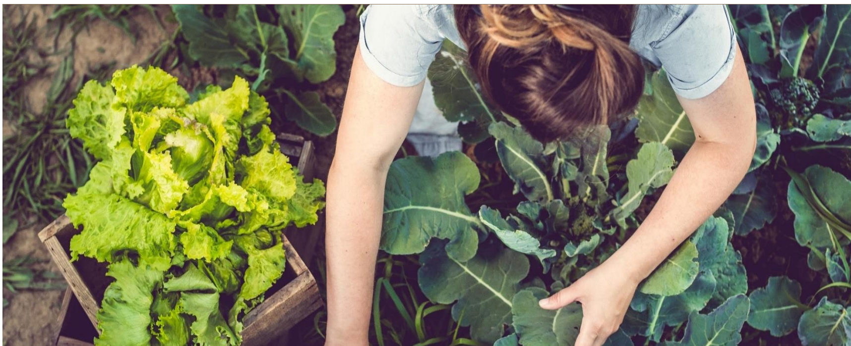
Afbeeldingsbijschrift: Om uw document er professioneel uit te laten zien, hebben de koptekst, de voettekst, het voorblad en de tekstvakken in Word een ontwerp in dezelfde stijl.