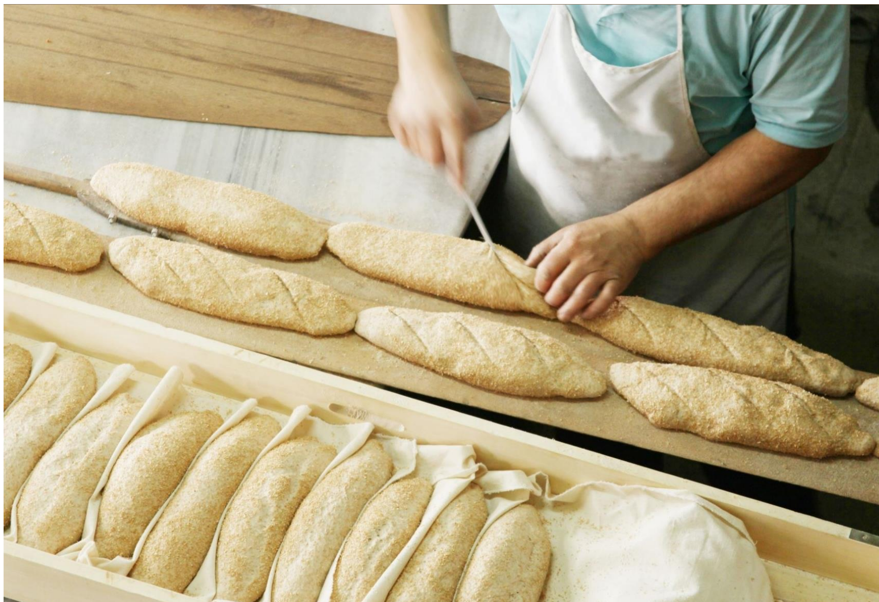
Afbeeldingsbijschrift: Om uw document er professioneel uit te laten zien, hebben de koptekst, de voettekst, het voorblad en de tekstvakken in Word een ontwerp in dezelfde stijl.