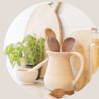
Afbeeldingsbijschrift: Om uw document er professioneel uit te laten zien, hebben de koptekst, de voettekst, het voorblad en de tekstvakken in Word een ontwerp in dezelfde stijl.

Video is een geweldige manier om mensen te overtuigen. Wanneer u op Onlinevideo klikt, kunt u de invoegcode gebruiken voor de video die u wilt toevoegen. U kunt ook een trefwoord typen om online te zoeken naar een geschikte video.