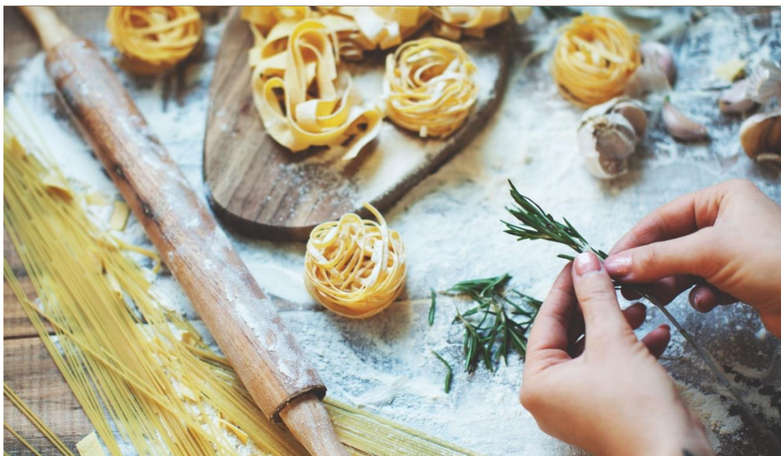
Afbeeldingsbijschrift: Om uw document er professioneel uit te laten zien, hebben de koptekst, de voettekst, het voorblad en de tekstvakken in Word een ontwerp in dezelfde stijl.